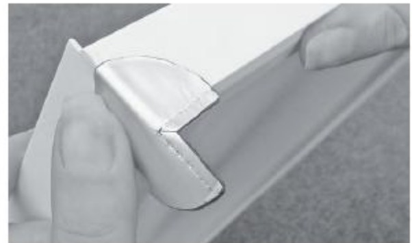
2. Anschließend um die Fuge kleben 2. Following glue around the gap