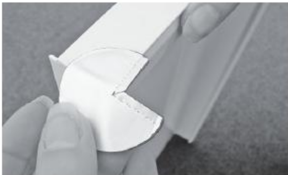
1. DFT 40 am Fensterbankabschluss fixieren 1. Fix DFT 40 at the windowsill end seal

The EG safety data sheet 218000070 must be observed.