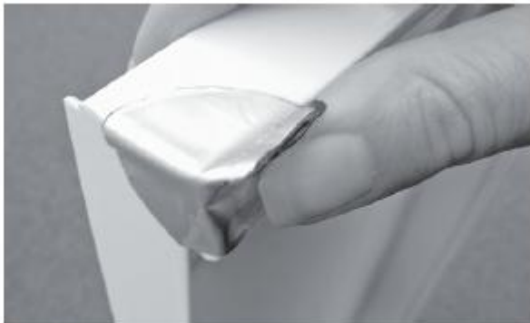
3. Umformen und andrücken 3. Form and press