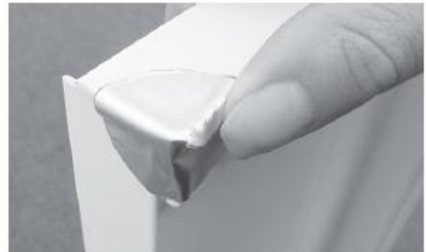
4. Stoßfuge an der Kante verbinden 4. Connect butt-joint on the edge